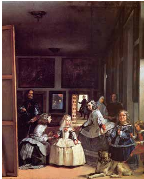
Diegas Velaskesas. Meninos (Rūmų damos, 1656)

1. Pamažtyk, ką šie žmonės galėtų sakyti.