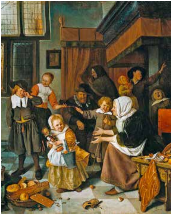
Janas Stenas. Šv. Mikalojaus diena (1665–1668)