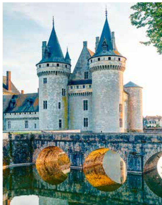
Riterių ir pilių laikai